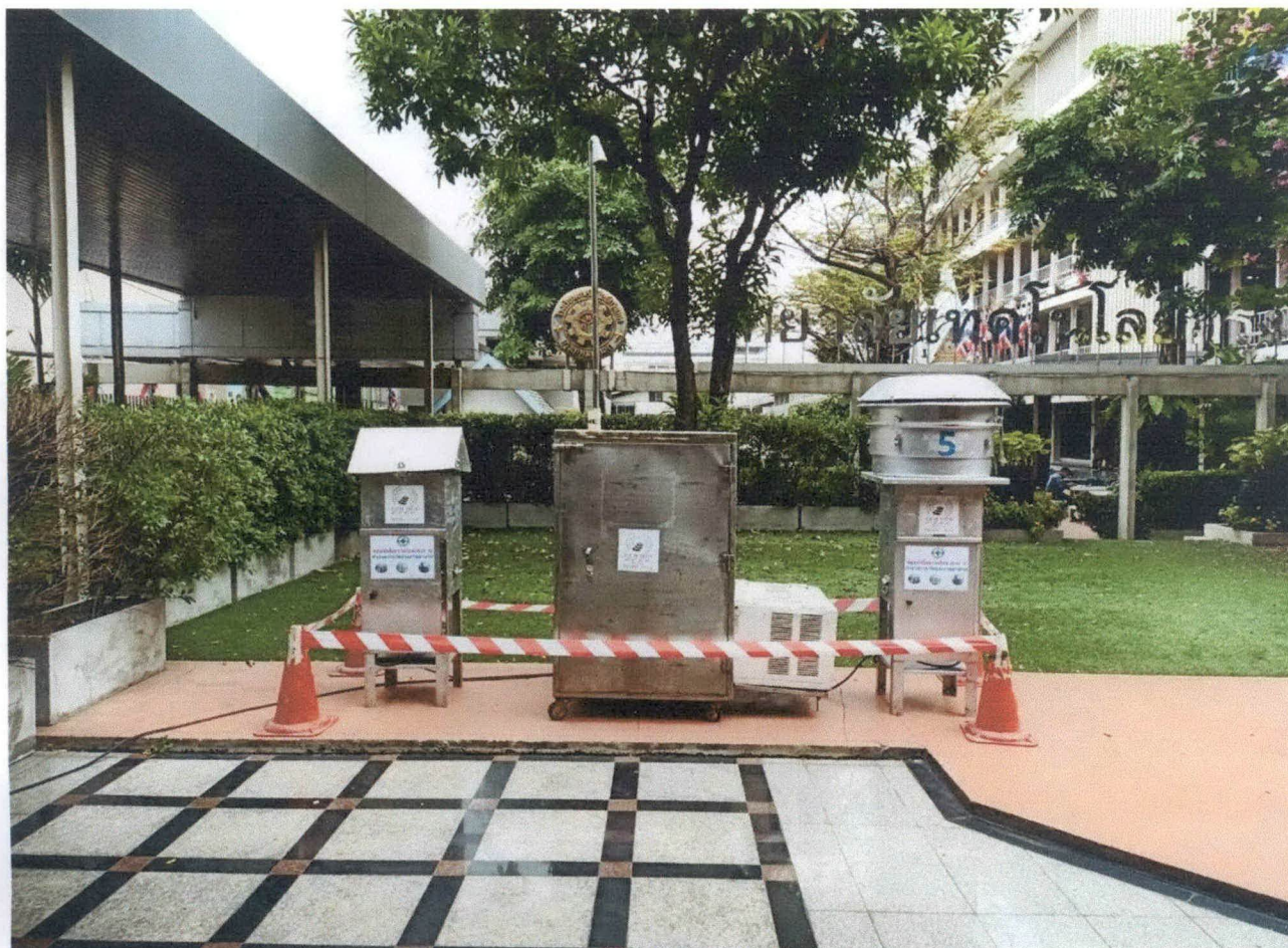
รูปภาพที่ 1