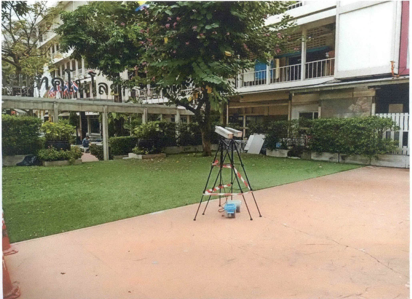
รูปภาพที่ 2 เครื่องมือการตรวจวัดคุณภาพเสียง